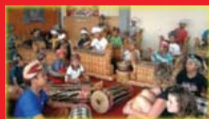
Gamelan Gong Cenik