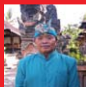
I Made Djimat

Con gli strumenti originali del gamelan , l'orchestra di Bali